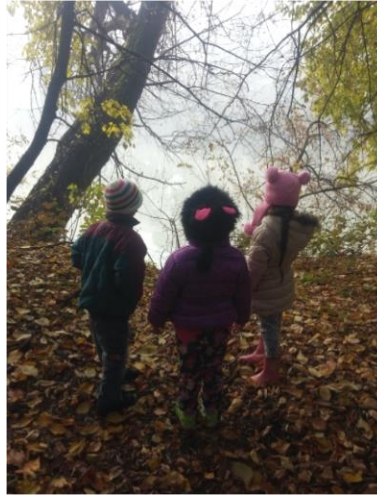
Csivitelő óvodásokkal a Maros-parton.

Az élménypedagógiában gyakran a természet a tanulás helyszíne. Saját komfortzónánkból kilépve erősebben hatnak ránk a külvilág ingerei. A természet lenyűgöző ereje mellett az itt szerzett saját élmények erős érzéseket váltanak ki belőlünk. Ezért is kínál hatékony terápiás lehetőséget.